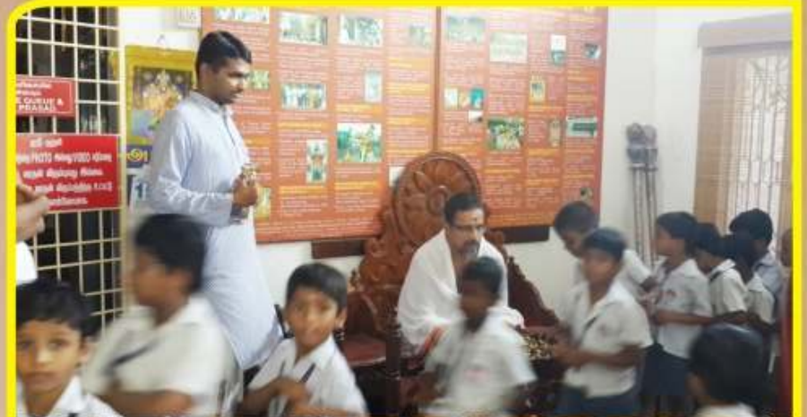
நவம்பர் 14 - ஸ்ரீபெரும்புதூர் விவேகானந்தா வித்யாலய மாணவர்கள் மதுரபுரி ஆஸ்ரமத்தில் குழந்தைகள் தினத்தன்று