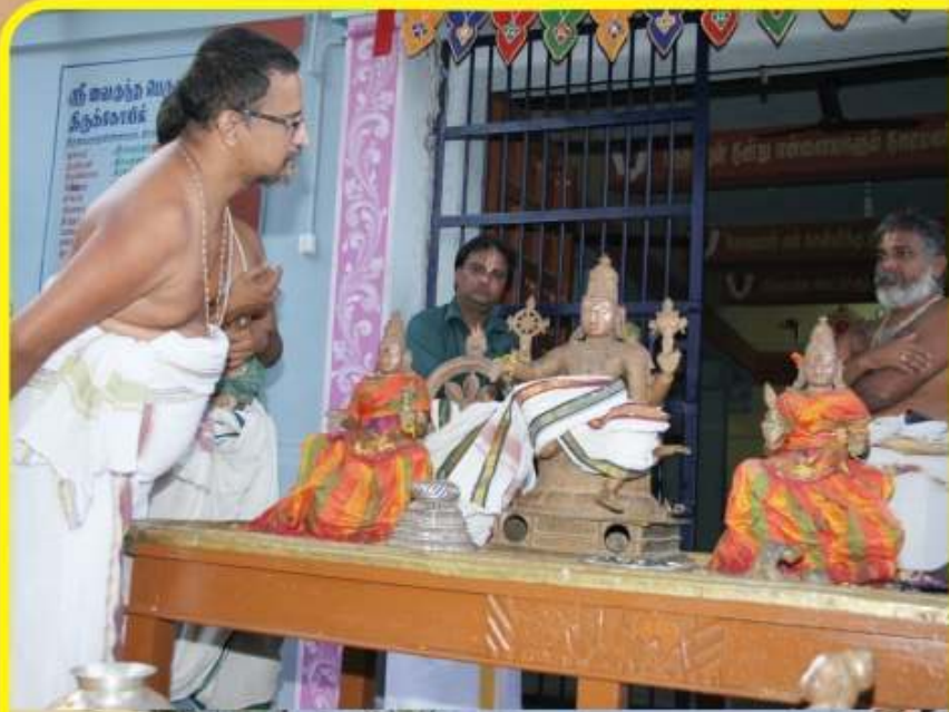
நவம்பர்-9 - திருநாகர்க்கோட்டில் திய்ய தேசம் - திருவிண்ணகரம் ஸ்ரீவைகுண்டநாதர் திருக்கோவில் சம்பரோக்ஷணம்