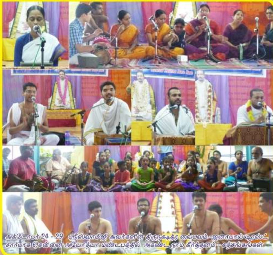
அக்டோபர் 24 - 29 ப்ரீஸ்வரயிஜி அவர்களின் திருநகூத்ர வைபவம் - ஜனாபாய் டிரஸ்ட் சார்பாக சென்னை அயோத்யாமண்டபத்தில் அகண்ட நாம கீர்த்தனம் - சத்தசங்கங்கள்