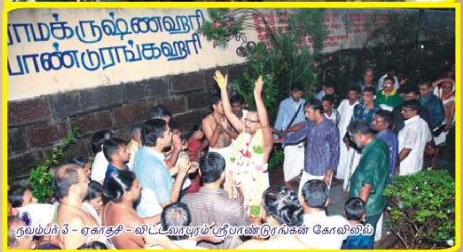
நவம்பர் 3 - ஏகாதசி - விட்டலாபுரம் ஸ்ரீபாண்டரங்கன் கோவிலில்