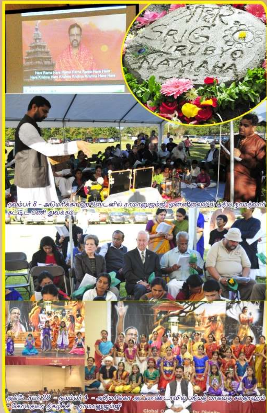
நவம்பர் 8 - அமெரிக்கா ஹலிவுட்ஸில் ராமானுஜம்ஜி முன்னிலையில் ப்ரதீய நாமத்வாரீ கட்டுட பணி துவக்கம்